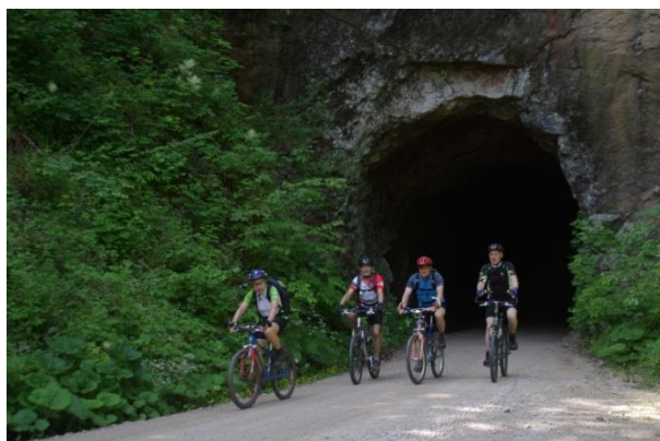
Ehem. Waldbahn (Tour 3)