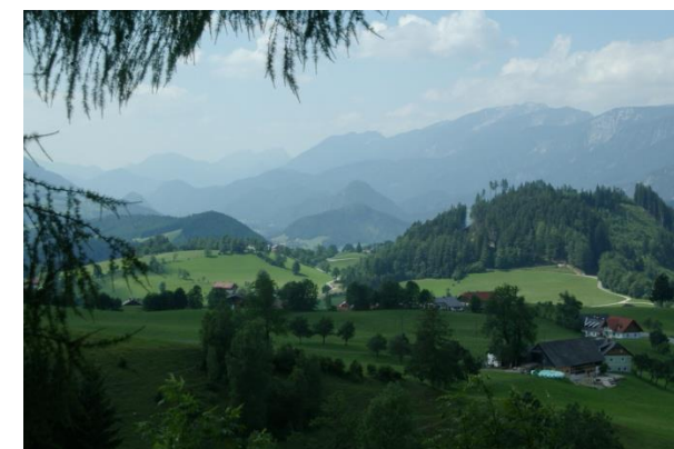
Oberwengerrunde oberhalb Spital am Pyhrn (Tour 9)