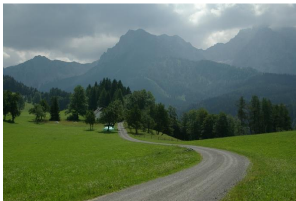
Kl. Pyhrgas (Mitte), Gr. Pyhrgas (re) (Tour 9)